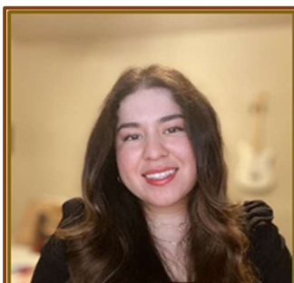
Jax Grande CA Camps & Retreats Committee

¿Luchas con la oración? ¿Anhelas una vida de oración más fuerte y constante? Hay buenas noticias! ¡Dios conoce nuestro corazón y nos ha dado al Espíritu Santo para ayudarnos a orar! Ven y descubre cómo el Espíritu Santo nos guía, nos fortalece en nuestras debilidades e intercede por nosotros. Conoce cómo Él anhela guiarnos en la oración y revelarnos el corazón del Padre. Seremos inspirados al aprender de Romanos 8:26, cómo el Espíritu Santo anima, empodera y transforma nuestras oraciones.