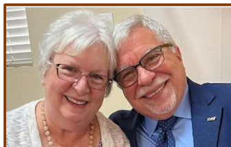
Diana Pruitt First Lady, CA

Únete a un espacio divertido y acogedor donde la fe se conecta con la vida real. A través de conversaciones honestas y la conexión con otros, esta clase te empoderará para crecer, superar lo que te detiene y construir amistades significativas, mientras aprendes cómo la fe moldea quién tu eres y cómo vives.